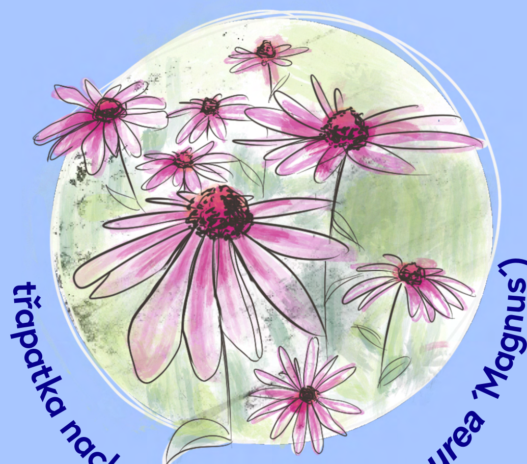
třapatka nachová ( Echinacea purpurea 'Magnus')