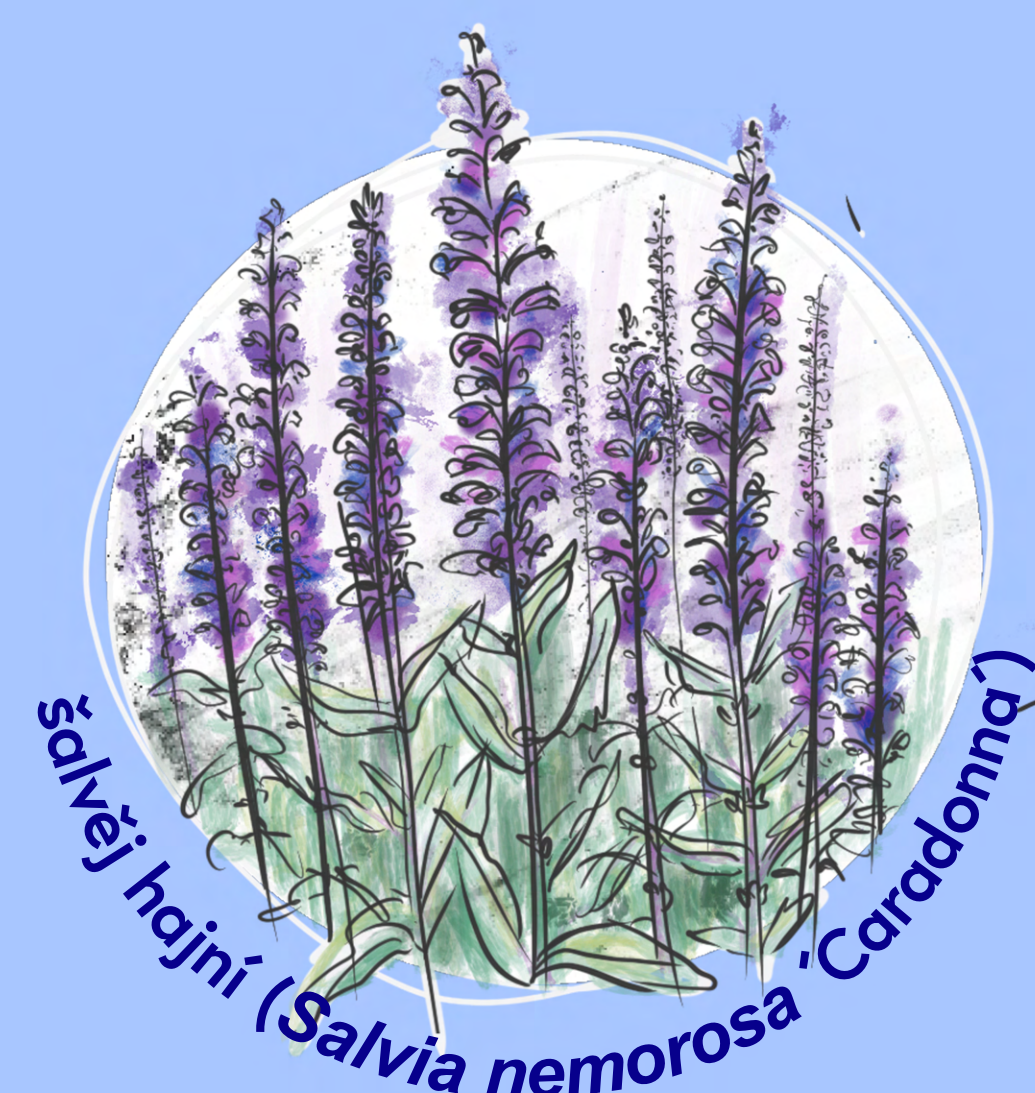
šalvěj hajní ( Salvia nemorosa 'Caradonna')