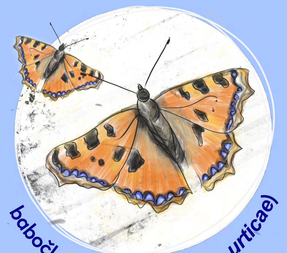
babočka kopřivová ( Aglais urticae )