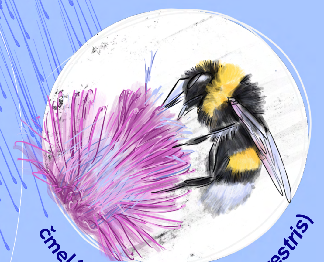
čmelák zemní ( Bombus terrestris )