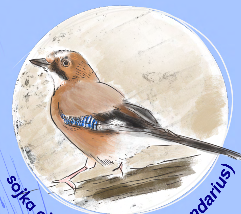
sojka obecná ( Garrulus glandarius )

Mezi rostlinami je vrstva mulče (štěrk), která zabraňuje prorůstání plevelů a brání vypařování vody.