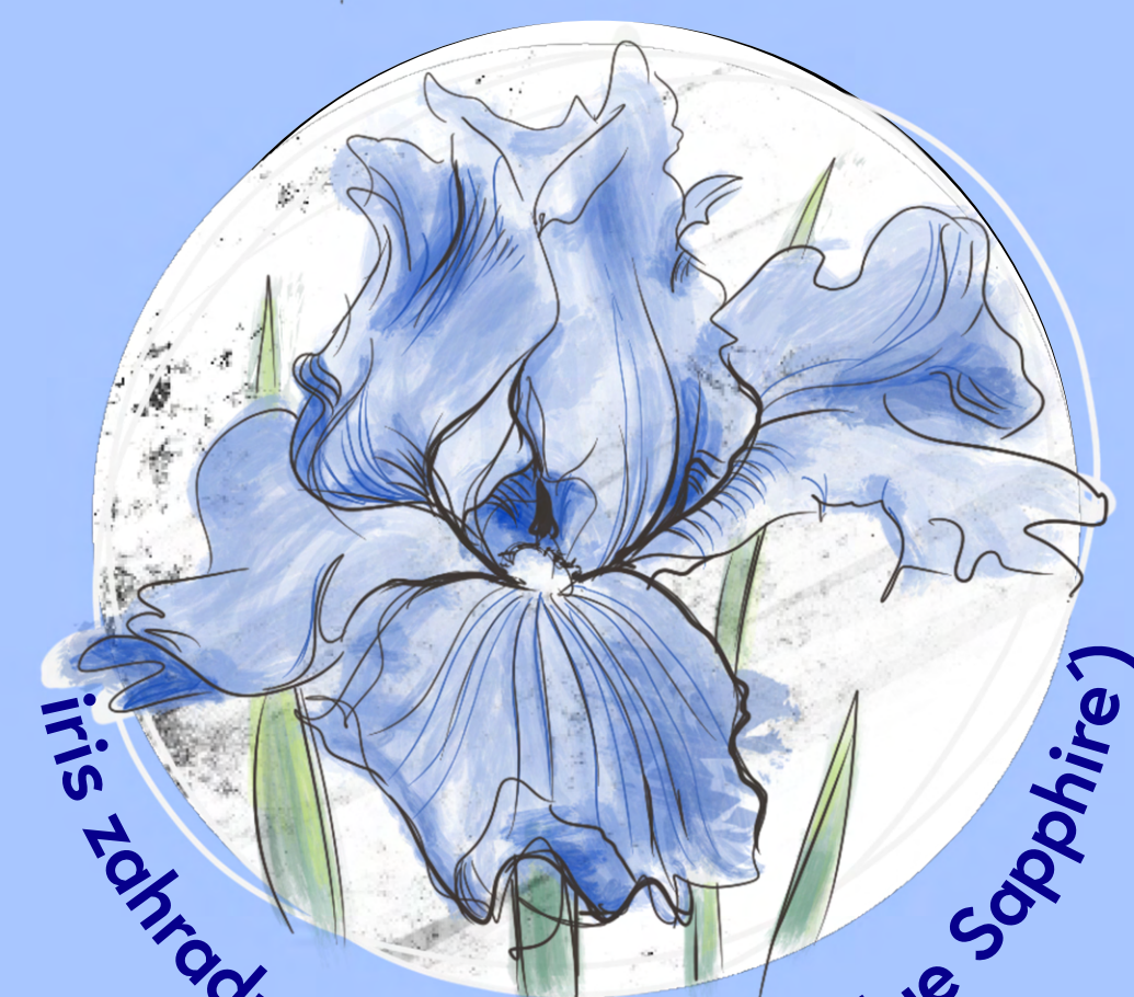
iris zahradní ( Iris barbatum 'Blue Sapphire')